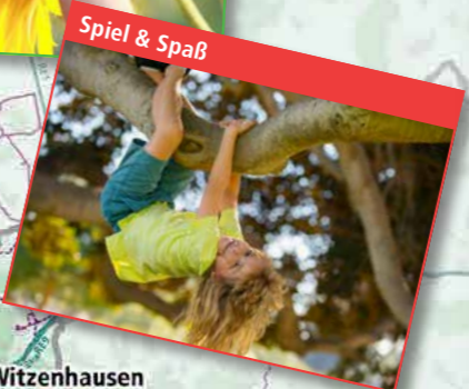
Spiel & Spaß