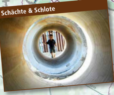
Schächte & Schlote