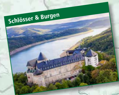
Schlösser & Burgen