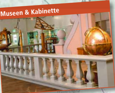
Museen & Kabinette