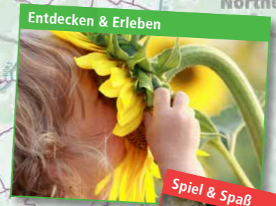
Entdecken & Erleben