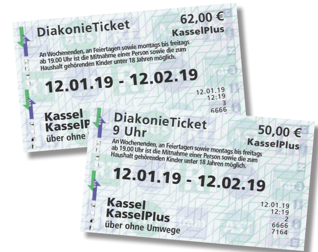
Diakonieticket allgemein und Diakonieticket 9 Uhr

Umso wichtiger ist, sich auch mit einem kleinen Geldbeutel eine günstige Fahrkarte leisten zu können. Die Diakonietickets sind persönliche Fahrkarten und nicht auf andere übertragbar.