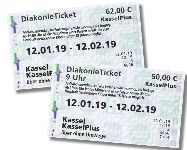
Diakonieticket allgemein und Diakonieticket 9 Uhr

Umso wichtiger ist, sich auch mit einem kleinen Geldbeutel eine günstige Fahrkarte leisten zu können. Die Diakonietickets sind persönliche Fahrkarten und nicht auf andere übertragbar.